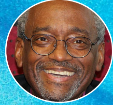
Michael Curry , Presiding Bishop, Episcopal Church

17.00 – 18.30 Mesa redonda: Consecuencias psicosociales de la esclavitud, el racismo estructural y el imperativo de la curación colectiva. Presenta y modera Scherto Gill, Instituto de Investigación GHFP / Universidad de Sussex