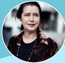
Myriam Cottias , historiador, centro nacional francés de investigación científica

17.00 – 18.30 Mesa redonda: Consecuencias psicosociales de la esclavitud, el racismo estructural y el imperativo de la curación colectiva. Presenta y modera Scherto Gill, Instituto de Investigación GHFP / Universidad de Sussex