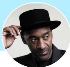
Marcus Miller , Músico y compositor afroamericano

18.30 – 19.30 Panel de diálogo: transformación cultural: música y curación. presentado y moderado por Yves Lema TV5 monde