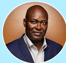
Achille Mbembe , Filósofo camerunés, teórico político e intelectual público